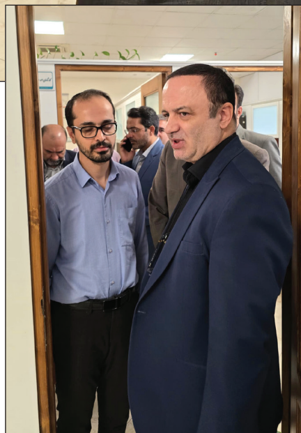
۷ نمایه خبری فرینا مروزی بر اخبار و رویدادهای دبیرخانه شورای عالی مناطق آزاد تجاری-صنعتی و ویژه اقتصادی مهر ۱۴۰۳