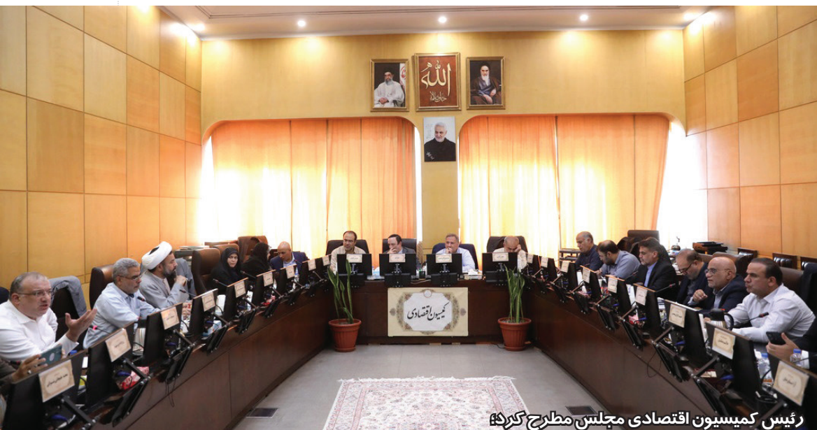
رئیس کمیسیون اقتصادی مجلس مطرح کرد