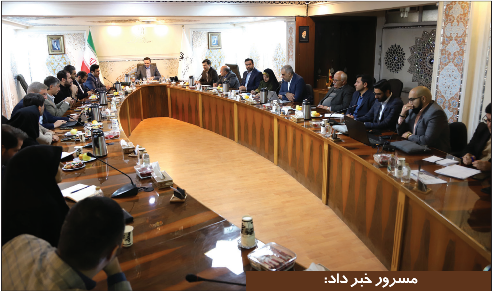
مسرور خبر داد: